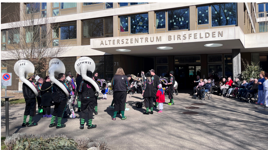
Grandiose Stimmung beim Auftritt der Guggemuusig Birsblootere!