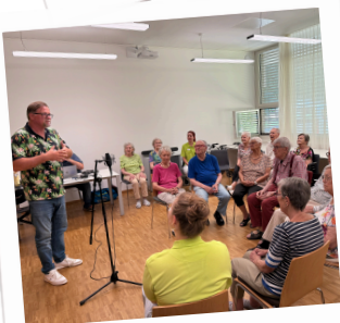
Heute wird die CD aufgenommen