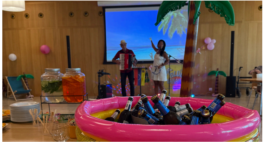
Unsere Cocktail Party lässt die sommerlichen Temperaturen weiter steigen.