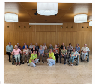
Unser AZB Chor