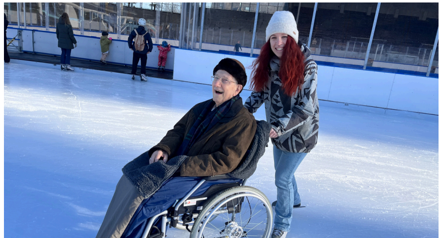
Das Vergnügen auf dem Eisfeld kennt keine Altersgrenze.