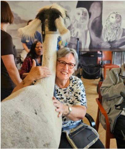
Ein Besuch der Lamas aus Flüeli-Ranft begeistert die Bewohnenden.