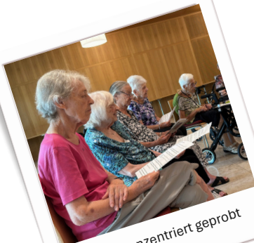
Es wird konzentriert geübt