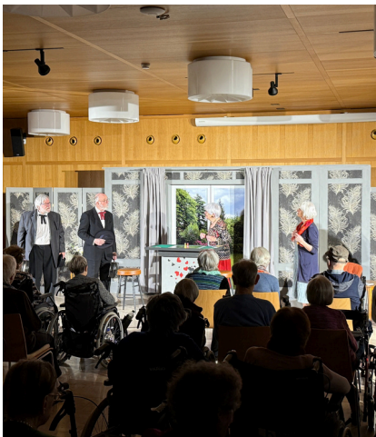
Vorführung des Seniorentheatrs Riehen.

Unser Team der Aktivierung plant regelmässige Ausflüge und Aktivitäten für die Bewohnenden und Gäste der Tages- und Nachtstruktur. Das unbestrittene Highlight war die 50-Jahr Feier des Alterszentrums Birsfelden mit der Aufnahme einer CD durch den Bewohnenden Chor mit dem eigenen Lied "Freud' und Spass am Läbe", welches speziell für uns von Stefan Roos komponiert wurde. Auch andere Veranstaltungen, sei es auf der Eisbahn, im Zolli oder bei einer Sommerparty, erfreuen unsere Bewohnenden immer wieder. Wir überraschen die Bewohnenden auch regelmässig mit saisonalen Geschenken, wie zu Ostern und Weihnachten, aber auch über das Jahr verteilt erhalten sie immer wieder kleine Überraschungen und Aufmerksamkeiten. Die schönen Ausflüge und Aktivitäten sind vor allem dank Spenden möglich und bereichern den Alltag unserer Bewohnenden und Gäste der Tages- und Nachtstruktur. Einen Auszug von den schönsten Momenten haben wir in der nachfolgenden Bilderreihe für Sie festgehalten.