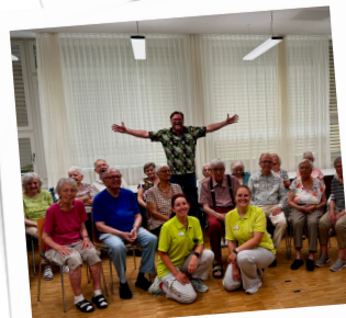
Die Aufnahmen sind geschafft