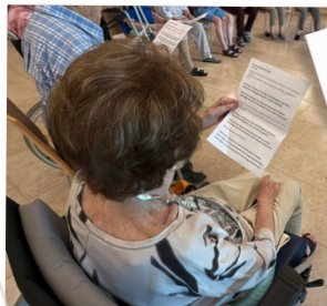
Die Texte werden fleissig geübt